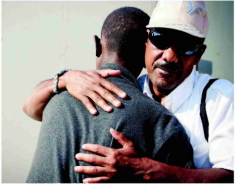
חיבוק ופרידה. נדרשים להוכיח אבהות

עִינַת פִּישְׁבַּיִן