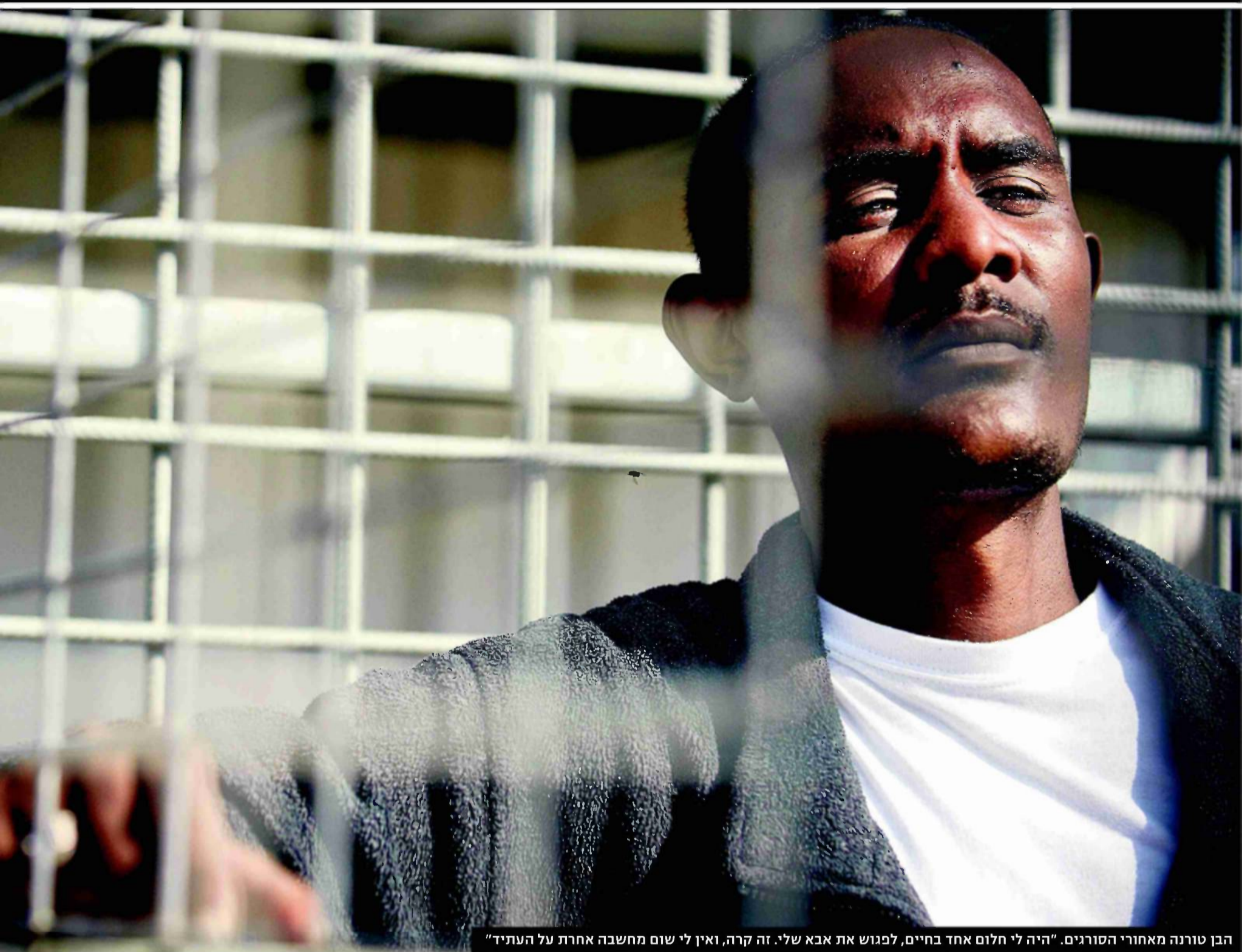
הבן טרונה מאחורי הסורגים. "היה לי חלום אחד בחיים, לפגוש את אבא שלי. זה קרה, ואין לי שום מחשבה אחרת על העתיד"

בתרגום בכלא של הפליטים בקציעות, אני יודע מה עושים להם בסיני, הורגים אותם שם. ידעתי שאין לי איך להוציא אותו, מאיפה אשלם את זה? ביום ראשון פתחתי את ה"ט" לפון, והם שוב התקשרו. אמרו לי, 'תשלם או שנשחט את הילד שלך. נזרוק אותו לים'."