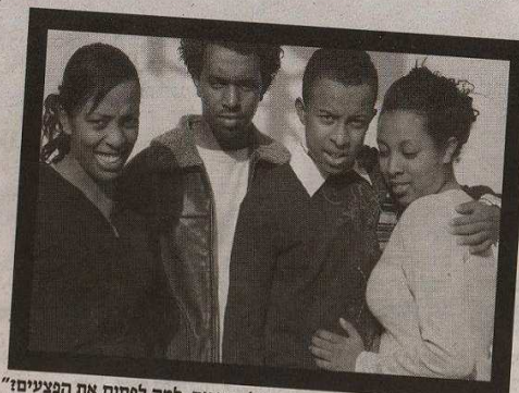
משפחת אלמה. "אנחנו לא מדברים על ההורים. למה לפתוח את הפצעים?"

"זה מעצבן שמציעים בכלל דבר כזה. אם אני אשב לבד בבית ריק למישהו יהיה יותר קל? אבל ניצחתי, והתחוקתי. היום לפני חמש שנים חצי אני לא אתה. בחורה. עכשיו הרבה יותר קל, בלי הסיפור של בעיות בבית הספר, ולהסביר כל פעם למה אני באה לפגוש עם המורים ולא אחד ההורים. "אבל ורתיתי על עצמי. תוכננתי ללמוד ולא עשיתי