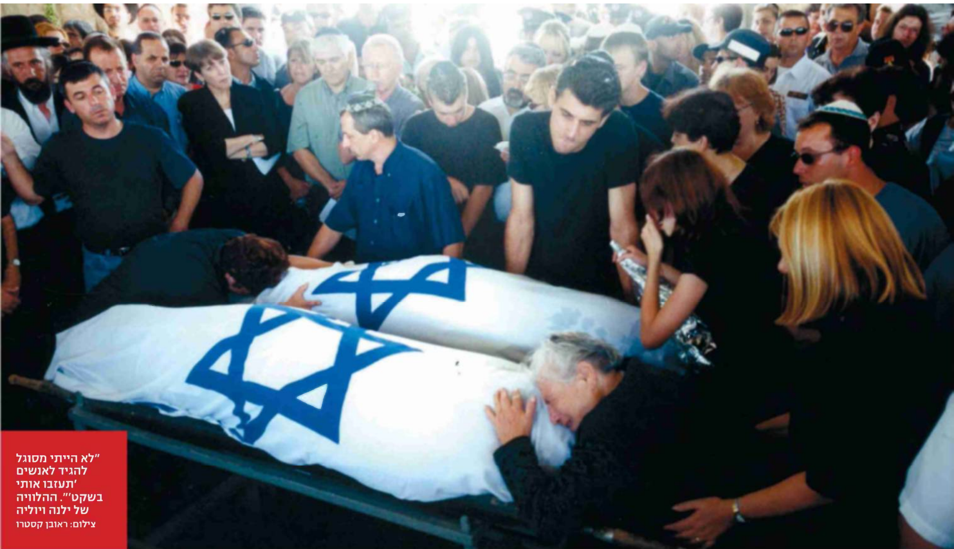
"לא הייתי מסוגל להגיד לאנשים 'תעזבו אותי בשקט'... ההלוויה של ילנה וילנה